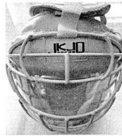
JKJO マーシャルワールド製