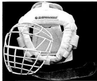
新極真会マーシャルワールド製

※ヘッドガード以下の製品に準じてください。詳細が不明な方は各所属長にお問合せください。